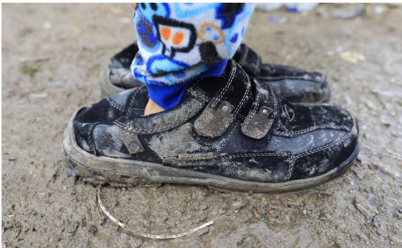
Ένα παιδί στέκεται έξω από τη σκηνή της οικογένειάς του στη βροχή σε μια περιοχή λίγο έξω από τον Καταυλισμό της Μόριας, στον εμπομαζόμενο «Ελαιώνα».